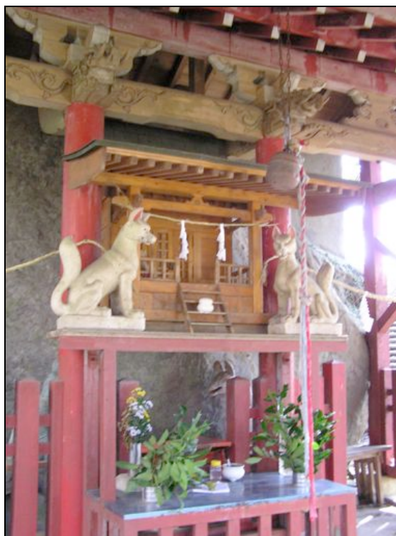
写真：母智丘の石峰稲荷

●都城・母智丘の石峰稲荷 母智丘（もちお）神社の裏手には巨石郡があり、石峰稲荷と呼ばれている。そのもつとも大きな巨石は二十畳敷きの広さがあり、その下には六畳敷き、三畳敷きの広さの岩穴があり、白狐、赤狐、白蛇が住んでいるといわれている。また、この石峰には隠れ世の国があり、特に選ばれた者のみが行くことが出来るという。昔、近くの