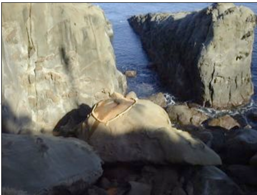
写真：鵜戸神宮亀石

山幸彦(彦火火出見尊)が、兄の海幸彦(火照命)の釣り針を探しに龍宮に赴かれ、海神の娘・豊玉姫命と深い契りを結ばれた。山