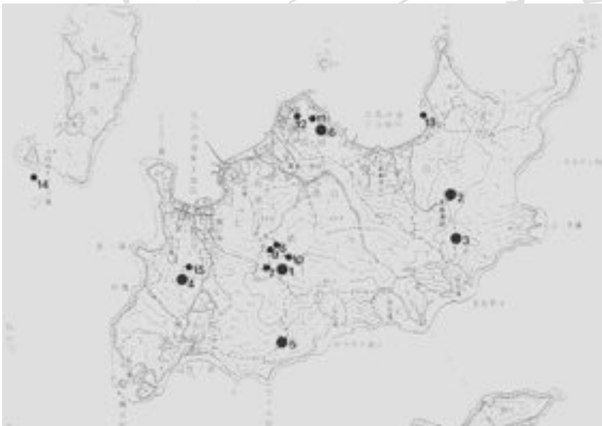
図：高島の全体地図